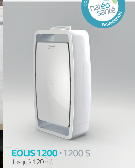
EOLIS 1200 • 1200 S Jusqu'à 120m 2 .