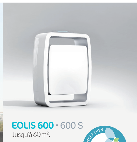
EOLIS 600 • 600 S Jusqu'à 60m 2 .