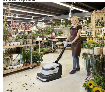
Nettoyage des sols facile et rapide - balayage, nettoyage et séchage de façon simultanée