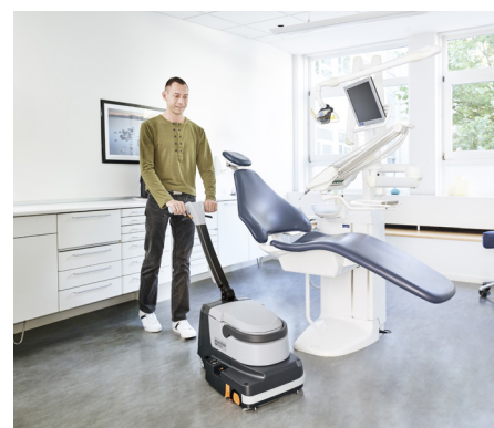
Performance en profondeur pour répondre pleinement aux normes d'hygiène des cliniques et des hôpitaux