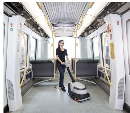
Facile à manœuvrer grâce à ses roulettes pivotantes et à la poignée réglable ergonomique