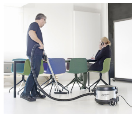
Le VP930 est le choix idéal pour les applications exigeantes comme dans les bureaux, les hôtels et les bâtiments publics